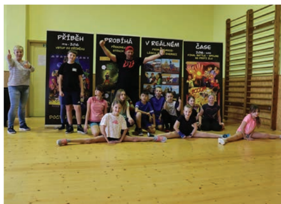
▲ Doctor Dancer v naší škole