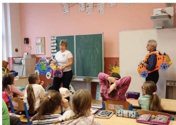
▲ Dopravní výchova od společnosti BESIP