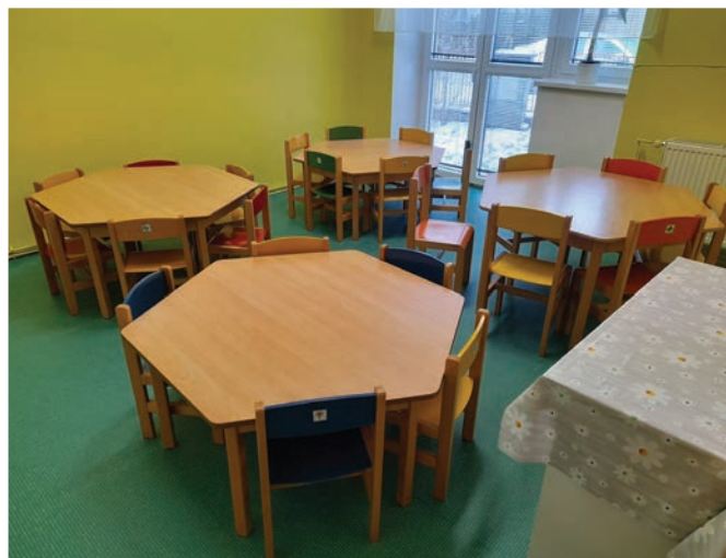
▲ Nová podlaha ve školní výdejně