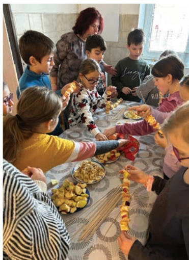
▲ Ovocné špízy 3. ročníku