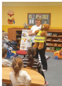
▲ Dopravní výchova s medvědem