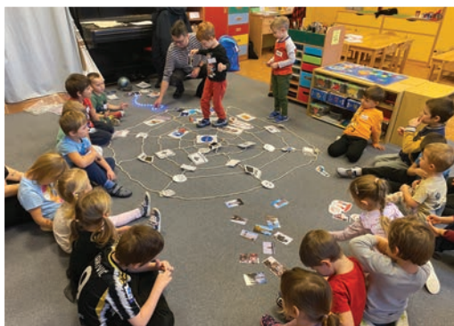
▲ V zasetí internetu