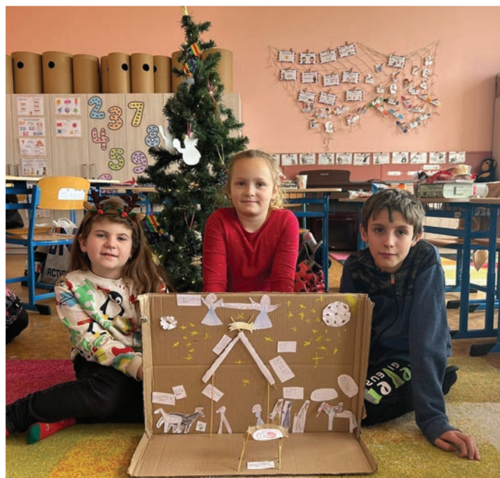
▲ Činnostní učení o vyjmenovaných slovech ve 3. ročníku