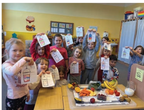
▲ Tvoříme zdravé smoothie