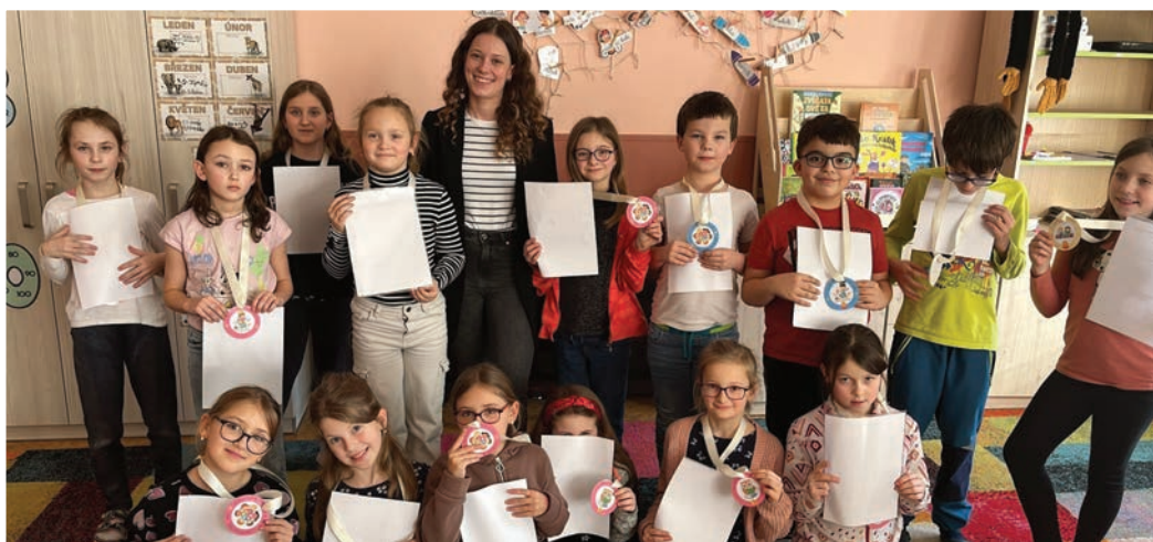
▲ Pololetní vysvědčení ve třetím ročníku