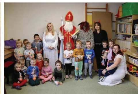
▲ Vzácna návštěva