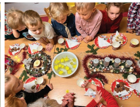
▲ Otevíráme si svá přání