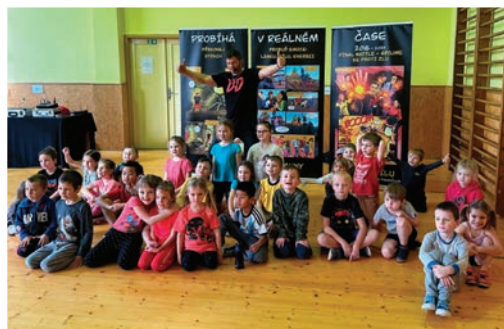
▲ Taneční dopoledne