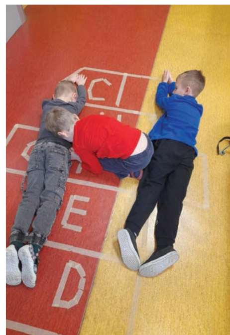
▲ Vывozování písmen v prvním ročníku