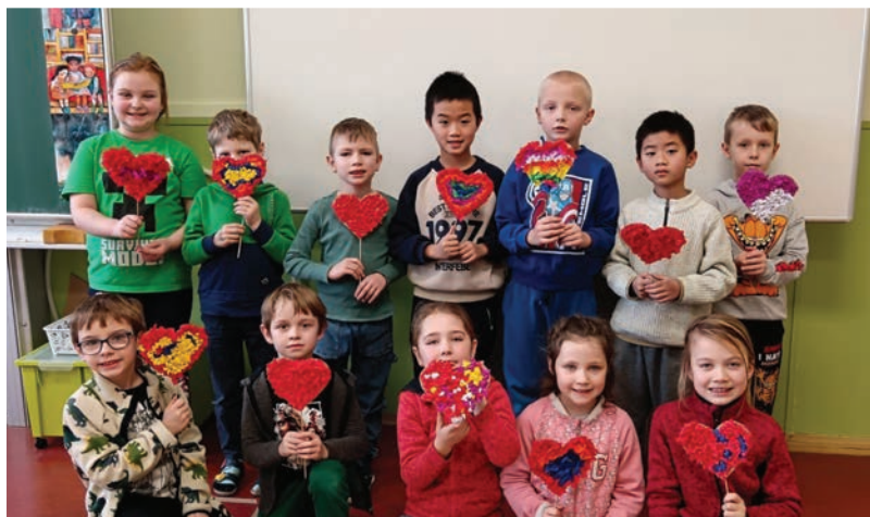
▲ Láskyplný den v 1. ročníku