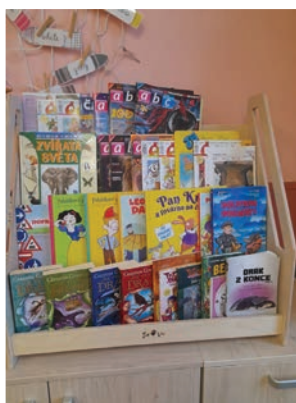
▲ Montessori knihovničky do každé třídy