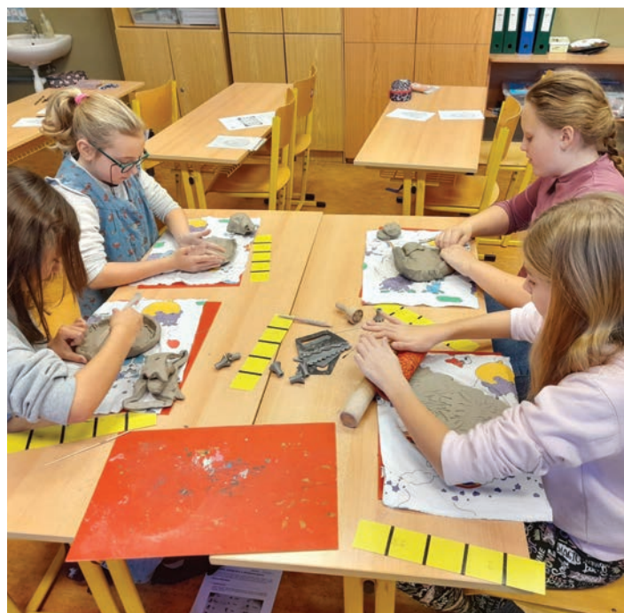
▲ Činnostní učení o době kamenné v 5. ročníku