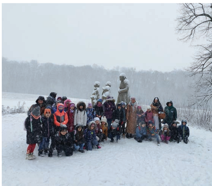
▲ Advenční výlet do Babiččina údolí