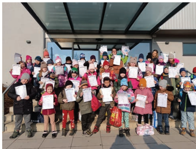
▲ Zakočení plaveckého výcviku