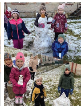
▲ Zimní radovánky