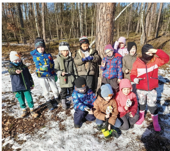
▲ Putování za zimním skřítkem 1. ročníku