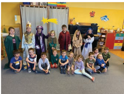
▲ Družina Tří králů