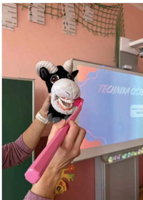
▲ Projekt Zdravé zuby na naší škole