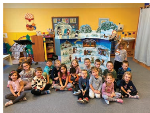
▲ S divadelními kulisami