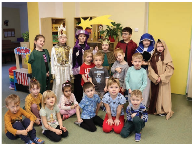
▲ Tři králové v naší škole