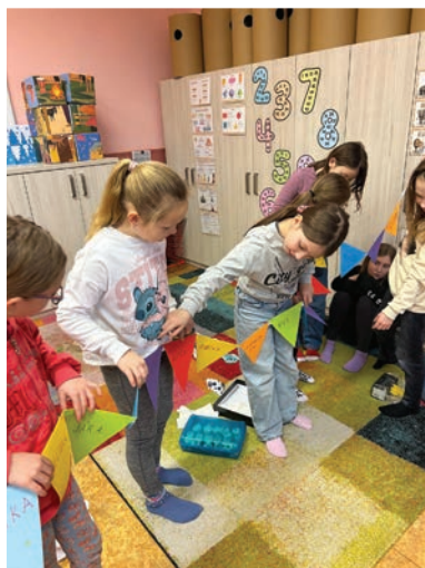
▲ Etická výchova ve třetím ročníku