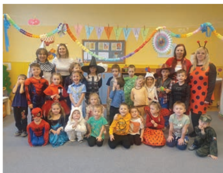
▲ Maškarní karneval