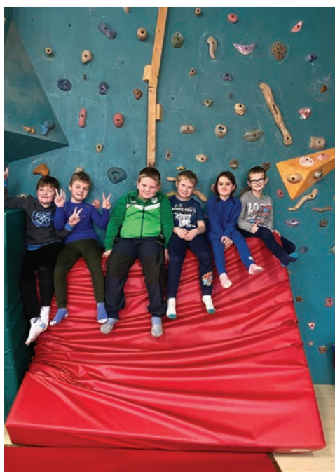
▲ Program Dvanáct měsíčků v DDM pro druhý ročník