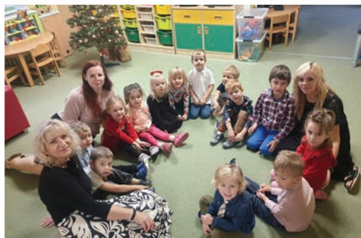
▲ Čekání na Ježíška