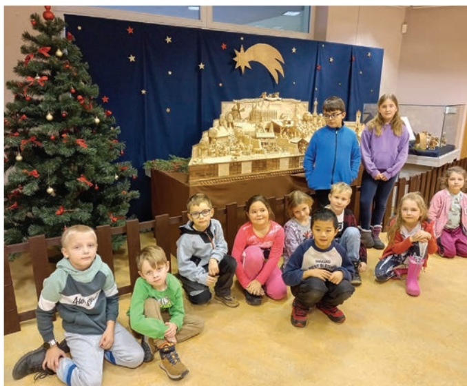
▲ Výlet školní družiny